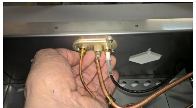
Kuva 4: Kallista grilliä