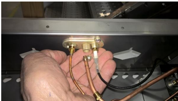
Kuva 5: Ota pilottipolttimen suutin käteesi