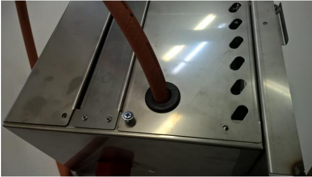
Kuva 1: Avaa huoltoluukku