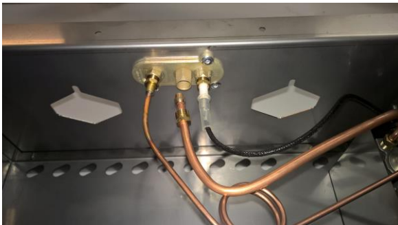
Kuva 3: Vedä kupuriputkea ulos