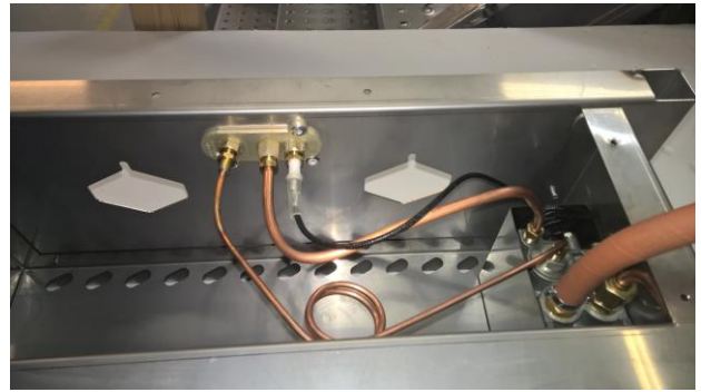
Kuva 2: Avaa keskimäinen messinkiruuvi